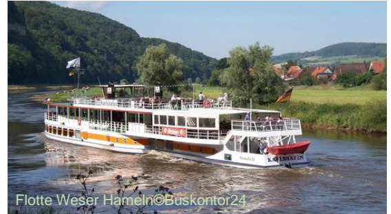
Flotte Weser Hameln