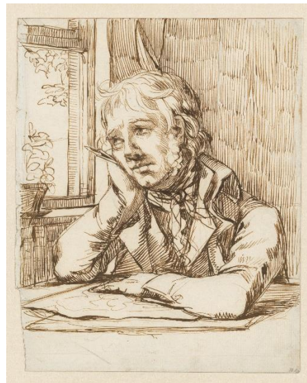
Caspar David Friedrich Selbstbildnis mit aufgestütztem Arm um 1802

Caspar David Friedrich steht wie kein anderer Maler für die Romantik , seine Werke sind Ikonen einer Zeit größter gesellschaftlicher Umbrüche. Anlässlich seines 250. Geburtstags präsentiert die Hamburger Kunsthalle über 100 seiner Gemälde und Zeichnungen, darunter die bedeutendsten von ihm geschaffenen Werke. Die Ausstellung bietet das umfangreichste Panorama seiner Kunst seit vielen Jahren. Welches zukunftsweisende Potenzial steckt in Friedrichs stimmungsvollen wie einprägsamen Landschaften? Im Zentrum seines Werks steht das Verhältnis von Mensch und Natur . Denn so unberührt die Natur in vielen Bildern auch erscheint, ist sie nie ohne den Menschen zu denken. Oftmals erscheint dieser bei Friedrich dabei als Rückenfigur in der Landschaft. Aber auch jene Bilder, die menschenleere Landstriche zeigen, setzen einen Blick voraus, der auf den Menschen zurückschließen lässt. Selten war dieses Verhältnis von Mensch und Natur so aktuell wie jetzt in Zeiten des Klimawandels.