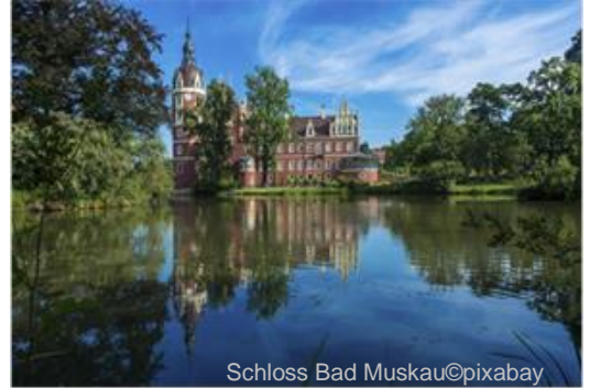
Schloss Bad Muskau

Der Spreewald ist mehr als nur die Spreewaldgurke. Diese einzigartige Flusslandschaft , die die UNESCO 1990 unter ihren Schutz stellte, werden wir gemeinsam entdecken. Uns erwartet eine üppige Flora und Fauna, urwüchsige Wälder und schilfgedeckte Bauernhäuser während einer Kahnfahrt am Tag und einer Lichterfahrt am Abend. Wir erleben zusammen einen Spreewälder Erlebnisabend inkl. einem Spezialitätenbuffet . Weitere Highlights sind zum einen die Fahrt mit der nostalgischen Waldeisenbahn von Weißwasser nach Bad Muskau und die anschließende Kutschfahrt im dortigen wunderschönen und weitläufigen „ Fürst-Pückler-Park “ als auch der Besuch des beeindruckenden Gartenkunstwerks Fürst Pücklers, dem Schloss und Park Branitz . Die Besichtigung der Burg Raddusch , einer weitgehend originalgetreuen Nachbildung einer slawischen Fliehburg , rundet das Programm ab.