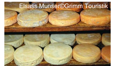
Elsass Munser