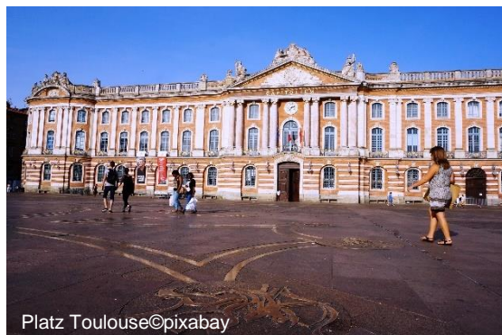
Platz Toulouse

Die Kernlandschaft im Herzen Frankreichs gehört zu den landschaftlich schönsten und zugleich kulturell reichsten Regionen Europas. Bereits der prähistorische Mensch siedelte in der Eiszeit in dem höhlenreichen Gebiet und hinterließ seine außerordentlich gut erhaltenen lebensnahen Tierdarstellungen. Wir beginnen unsere Reise mit der Besichtigung von Toulouse mit seiner schönen Altstadt, erblicken den Canal du Midi und machen einen Abstecher in das mittelalterliche Carcassonne. Die Dordogne lernen wir an ihrer schönsten Stelle kennen. Die Höhlen von Lascaux, der Gouffre de Padirac sowie Sarlat, Rocamadour und Albi befinden sich ebenfalls auf unserer Route.