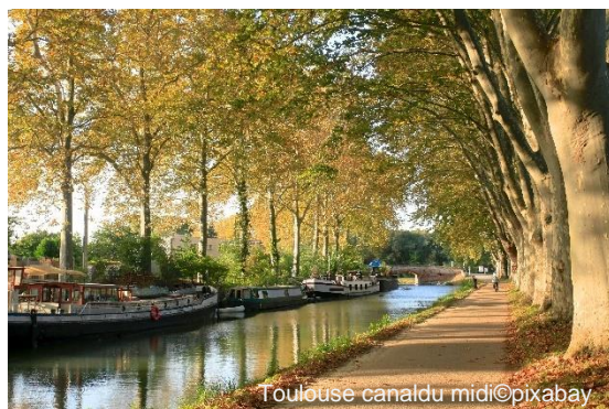
Toulouse canal du midi

Progr.-Nr: 49/21 - vom 10.09. bis 17.09.2021