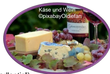
Käse und Wein

Uhrzeit folgt Stormarnstraße beim S-Bahnhof Ahrensburg Einstiegsmöglichkeiten in Bad Oldesloe, Elmenhorst, Bargteheide, Ammersbek und Ring 3